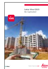
Leica Viva GS15