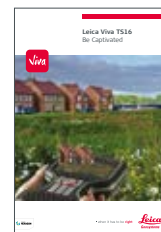
Leica Viva TS16